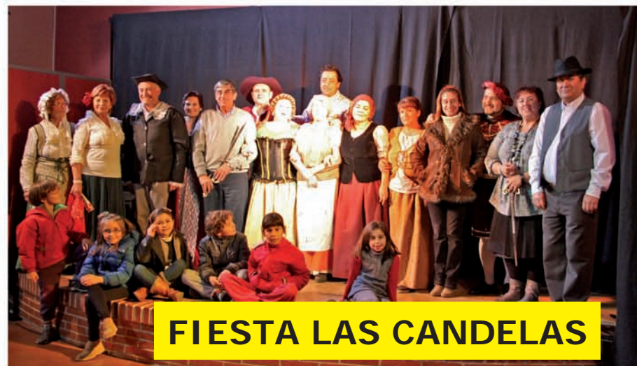
FIESTA LAS CANDELAS