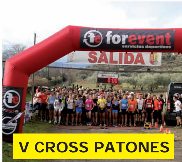
V CROSS PATONES